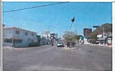
Vistas de la avenida Francisco I. Madero a la altura de la calle 16.