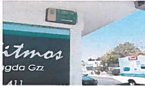
NOMENCLATURA: Avenida Francisco I. Madero, entre las calles 14 y 16, de Villa del Rio, San Francisco de Campeche