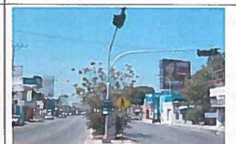
Vistas de la avenida Francisco I. Madero a la altura de la calle 16.