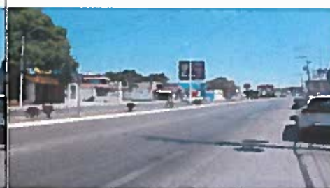
Vista de la avenida Francisco I. Madero en el punto medio de la calle 14 y 16.