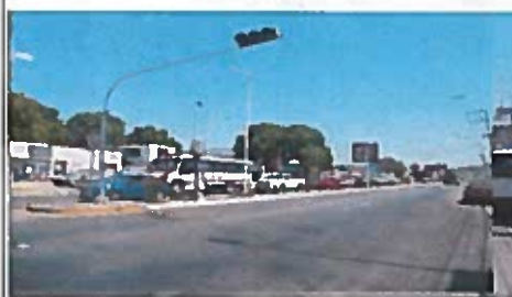
Vista de la avenida Francisco I. Madero a la altura de la calle 14.