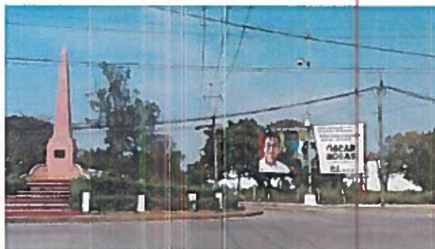
Fig. 2 Monumento a los Niños Héroes

2.- Constituidos en la Av Heroes del 21 Abril, Playa Nte., 24115 Cd del Carmen, Camp., a un costado del "Monumento a los Niños Héroes" SE OBSERVA el espectacular mencionado en el escrito de queja, con código de Registro Nacional de Proveedores INE RNP 000000390842 y una medida aproximada de 3mts de alto y 8mts de ancho, el cual se describe a continuación: del lado izquierdo, la fotografía de una persona aparentemente del sexo masculino, portando una camisa blanca, detrás de ella, la imagen de dos jóvenes de diferentes géneros portando cubrebocas; del lado derecho del espectacular se observa el siguiente texto: "PARA DEFENDER EL FUTURO DE CARMEN/MÁS MÁS CRÉDITO Y CAPACITACIÓN PARA LOS JÓVENES/ OSCAR ROSAS/PRESIDENTE/VA X CARMEN" seguido de los logotipos de los partidos políticos nacionales PAN, PRI y PRD; para constatar lo anterior se inserta al acta la siguiente evidencia fotográfica. -----