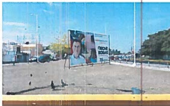
Fig. 5 Glorieta cuatro carriles

5.- Constituidos entre la Carretera costera del Golfo y la Av. Isla de Tris, Cd del Carmen, Camp., a un costado de la "Glorieta cuatro carriles" SE OBSERVA el espectacular mencionado en el escrito de queja, con código de Registro Nacional de Proveedores INE RNP 000000390811 y una medida aproximada de 3mts de alto y 8mts de ancho, el cual se describe a continuación: del lado izquierdo, la fotografía de una persona aparentemente de sexo masculino, portando una camisa blanca, detrás de ella, dos personas aparentemente de sexo femenino, de distintas edades; del lado derecho del espectacular se observa el siguiente texto "PARA DEFENDER A LAS MUJERES/MÁS CAPACITACION Y CRÉDITOS/ OSCAR ROSAS/PRESIDENTE/VA X CARMEN" seguido de los logotipos de los partidos políticos nacionales PAN, PRI y PRD; para constatar lo anterior se inserta al acta la siguiente evidencia fotográfica -----