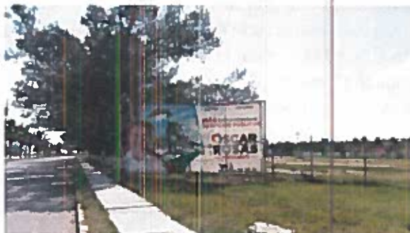
Fig. 1 Blvd. Playa Norte

1.- Constituidos en la acera del Boulevard Playa Norte, Cd del Carmen, Camp., aproximadamente a 500mts del inmueble conocido como "Domo del Mar", SE OBSERVA el espectacular mencionado en el escrito de queja, con código de Registro Nacional de Proveedores INE RNP 000000390907 y una medida aproximada de 3mts de alto y 8mts de ancho, el cual se describe a continuación: del lado izquierdo, la fotografía de una persona aparentemente del sexo masculino, portando una camisa blanca, en lo que parece ser una playa,; del lado derecho del espectacular se observa el siguiente texto: "PARA DEFENDER Y ACTIVAR EL TURISMO/MÁS INFRAESTRUCTURA/OSCAR ROSAS/PRESIDENTE/VA X CARMEN" seguido de los logotipos de los partidos políticos nacionales PAN, PRI y PRD; para constatar lo anterior se inserta al acta la siguiente evidencia fotográfica. -----