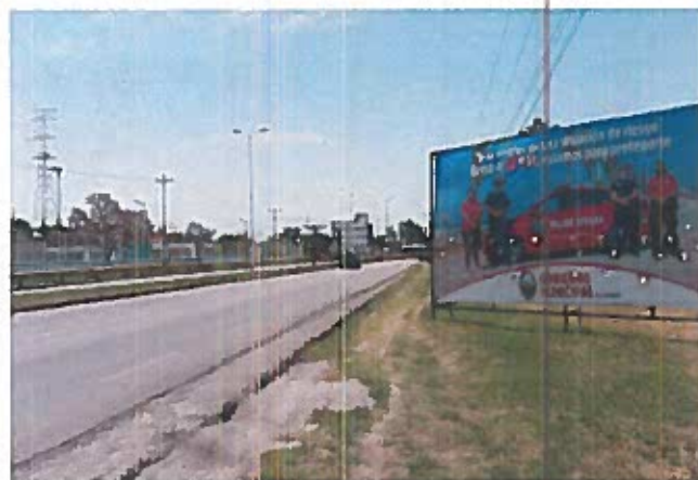
Fig.10 Carretera Costera del Golfo

10.- Constituidos en la Carretera Costera del Golfo Cd del Carmen, Camp., frente al "Deportivo CHE CHEN" NO SE OBSERVA el espectacular mencionado en el escrito de queja, SE OBSERVA un espectacular, con una medida aproximada de 3mts de alto y 8mts de ancho, en el cual se pueden observar cuatro personas con uniformes azul y rosa, posando frente a un vehículo de color rosa con la leyenda "Mujer Segura", en la parte superior se puede leer el texto "Si te sientes en una situación de riesgo llama al 911, estamos para protegerte", en la parte inferior se puede leer el texto "Gobierno Municipal del Carmen"-----