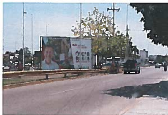
Fig. 8 Av. Puerto del Progreso, esquina con Calle José Narvaez

8.- Constituidos en la Av. Puerto del Progreso, esquina con Calle José Narvaez, Cd del Carmen, Camp., ENFRENTA DEL "Paradero de Camiones 23 de julio" SE OBSERVA el espectacular mencionado en el escrito de queja, con código de Registro Nacional de Proveedores INE RNP 000000390828 y una medida aproximada de 3mts de alto y 8mts de ancho, el cual se describe a continuación: del lado izquierdo, la fotografía de una persona aparentemente del sexo masculino, portando una camisa blanca, detrás de ella, dos personas sosteniendo un documento; del lado derecho del espectacular se observa el siguiente texto: "PARA DEFENDER AL EMPLEO/MÁS APOYO AL COMERCIO/ OSCAR ROSAS/PRESIDENTE/VA X CARMEN" seguido de los logotipos de los partidos políticos nacionales PAN, PRI y PRD; para constatar lo anterior se inserta al acta la siguiente evidencia fotográfica -----