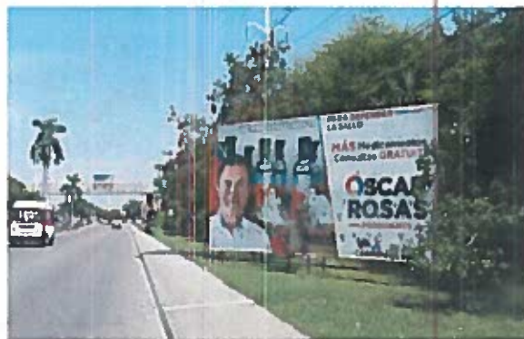
Fig. 6 Av. Isla de Tris

6.- Constituidos en la Av. Isla de Tris, a contra esquina de la Calle Angela Peralta Cd del Carmen, Camp., SE OBSERVA el espectacular mencionado en el escrito de queja, con código de Registro Nacional de Proveedores INE RNP 000000390918 y una medida aproximada de 3mts de alto y 8mts de ancho, el cual se describe a continuación: del lado izquierdo, la fotografía de una persona aparentemente del sexo masculino, portando una camisa blanca, detrás de ella, lo que parecen ser tanque contenedores y equipo médico; del lado derecho del espectacular se observa el siguiente texto: "PARA DEFENDER LA SALUD/MÁS MEDICAMENTOS Y CONSULTAS GRATUITAS/ OSCAR ROSAS/PRESIDENTE/VA X CARMEN" seguido de los logotipos de los partidos políticos nacionales PAN, PRI y PRD; para constatar lo anterior se inserta al acta la siguiente evidencia fotográfica -----