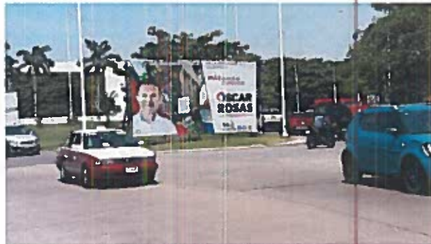
Fig.9 Av. Puerto del Progreso / Calle José Narvaez

9 - Constituidos en la Av. Puerto del Progreso, esquina con Calle José Narvaez, Cd del Carmen, Camp., a un costado de la "Glorieta Cuatro Camles" SE OBSERVA el espectacular mencionado en el escrito de queja, con código de Registro Nacional de Proveedores INE RNP 000000390828 y una medida aproximada de 3mts de alto y 8mts de ancho, el cual se describe a continuación: del lado izquierdo, la fotografía de una persona aparentemente del sexo masculino, portando una camisa blanca, detrás de ella, dos personas sosteniendo un documento, del lado derecho del espectacular se observa el siguiente texto " PARA DEFENDER AL EMPLEO/MÁS APOYO AL COMERCIO/ OSCAR ROSAS/PRESIDENTE/VA X CARMEN " seguido de los logotipos de los partidos políticos nacionales PAN, PRI y PRD; para constatar lo anterior se inserta al acta la siguiente evidencia fotográfica -----