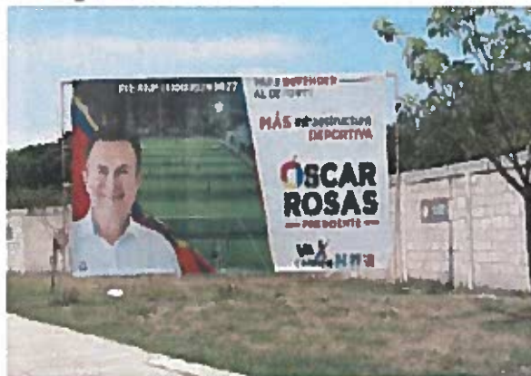
Fig. 4 Av. Boquerón del Palmar

4.- Constituidos en la Av. Boquerón del Palmar, a contra esquina de la Calle Tulipán Cd del Carmen, Camp., SE OBSERVA el espectacular mencionado en el escrito de queja, con código de Registro Nacional de Proveedores INE RNP 000000390927 y una medida aproximada de 3mts de alto y 8mts de ancho, el cual se describe a continuación: del lado izquierdo, la fotografía de una persona aparentemente del sexo masculino, portando una camisa blanca, detrás de ella, lo que parece ser un "Campo de Fútbol"; del lado derecho del espectacular se observa el siguiente texto: "PARA DEFENDER AL DEPORTE/MÁS INFRAESTRUCTURA DEPORTIVA/ OSCAR ROSAS/PRESIDENTE/VA X CARMEN" seguido de los logotipos de los partidos políticos nacionales PAN, PRI y PRD, para constatar lo anterior se inserta al acta la siguiente evidencia fotográfica -----