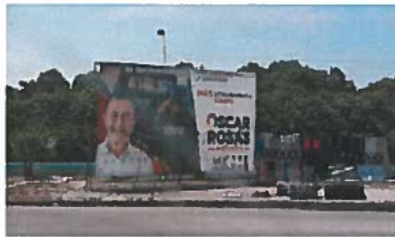
Fig. 3 Av. Malecón de la Caleta

3.- Constituidos en la Av. Malecón de la Caleta s/n, esquina con Calle 74, 24117 Cd del Carmen, Camp., a un costado del "Parque Obrera" SE OBSERVA el espectacular mencionado en el escrito de queja, con código de Registro Nacional de Proveedores INE RNP 000000390898 y una medida aproximada de 3mts de alto y 8mts de ancho, el cual se describe a continuación: del lado izquierdo, la fotografía de una persona aparentemente del sexo masculino, portando una camisa blanca, detrás de ella, una persona con uniforme en el que se puede leer el texto "Policia Municipal"; del lado derecho del espectacular se observa el siguiente texto: "PARA DEFENDER LA SEGURIDAD/MÁS INFRAESTRUCTURA Y EQUIPO/ OSCAR ROSAS/PRESIDENTE/VA X CARMEN" seguido de los logotipos de los partidos políticos nacionales PAN, PRI y PRD; para constatar lo anterior se inserta al acta la siguiente evidencia fotográfica -----