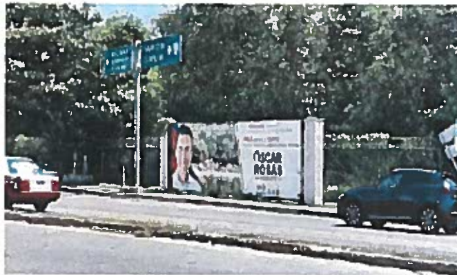
Fig. 7 Av. Isla de Tris, cruzamiento con la Av. 10 de julio

7.- Constituidos en la Av. Isla de Tris, cruzamiento con la Av. 10 de julio Cd del Carmen, Camp., SE OBSERVA el espectacular mencionado en el escrito de queja, con código de Registro Nacional de Proveedores INE RNP 000000390915 y una medida aproximada de 3mts de alto y 8mts de ancho, el cual se describe a continuación: del lado izquierdo, la fotografía de una persona aparentemente del sexo masculino, portando una camisa blanca, detrás de ella, lo que parece ser un bosque; del lado derecho del espectacular se observa el siguiente texto: "PARA DEFENDER LOS INGRESOS DE LAS COMUNIDADES/MÁS MÁS APOYO AL CAMPO, CAMINOS COSECHEROS, JAGUEYES Y POZOS PROFUNDOS/ OSCAR ROSAS/PRESIDENTE/VA X CARMEN" seguido de los logotipos de los partidos políticos nacionales PAN, PRI y PRD, para constatar lo anterior se inserta al acta la siguiente evidencia fotográfica -----