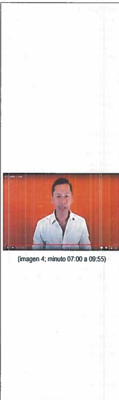
(imagen 4; minuto 07:00 a 09:55)

Los panistas no se fueron a seguir a los dirigentes del PAN, al contrario está muy molesto, los perredistas tampoco y muchos priistas desde hace tiempo dejaron el PRI