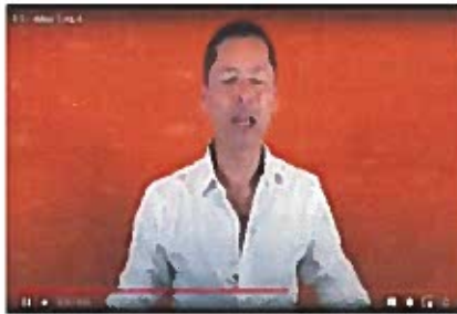
(imagen 3; minuto 04:14 a 07:00)

y pues del partido verde, ese creo ya todo campeche sabía que era propiedad de Alejandro Moreno, alias ALITO, pues ahí pone una ex diputada, ex candidata una muchacha que regularmente ALITO utiliza en los procesos electorales para generar divisionismo de voto, esa es parte de su estrategia la división del voto opositor y que él a través de sus esfuerzos y de su dinero logré reunir la cantidad de votos suficientes a través de pago y ver que se alinean los astros y su sobrino tiene la posibilidad de ganar la elección.