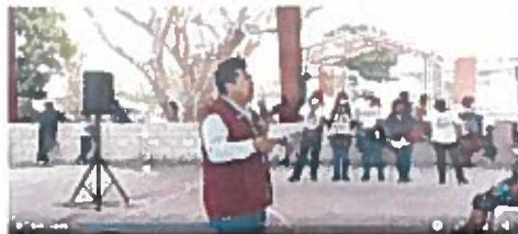
Minuto 8:01 a 10:00

venirles a pedirles el voto, les vengo a comentar que venimos a decirle que analicen el voto, yo sé que hay gente que no está conforme porque no le tocó un programa de piso, cuarto, baño o algún apoyo que vimos o de programa federal no tiene alguna beca, eso lo tengo muy claro, no todo es responsabilidad de nosotros, pero hemos trabajado por ustedes y la muestra son los casi siete millones de pesos que le metimos a su comunidad en tres años. Sólo le voy a decir algo, el seis de junio muy por la mañana cuando vayan ustedes a las urnas a votar soy analicen lo que hoy les vine a decir que le he hecho a su pueblo y lo que van a venir a bendecirles los del PRI, los del PAN los del PRD y los de MOCÍ, que todos juntitos salieron exactamente del PRI y sólo se distribuyeron como candidatos. Analicen lo que les van a decir porque les van a decir ahorita que les van a pagar el cincuenta por ciento de su luz, el cincuenta por ciento de su gas"