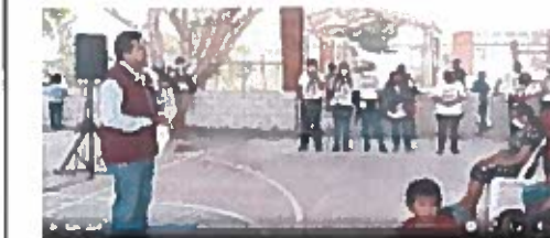
Minuto 4:01 a 6:00

quinientos pesos o más o menos once mil quinientos pesos por kilómetro, ¿saben cuántas personas pasan por ese camino? ¿cincuenta? ¿sesenta? nos tocaban como de quinientos pesos por persona para componer un kilómetro. No han aceptado, cuando en otros lados le hemos metido muchísimo más que ellos, y hoy les puedo decir que son muy pocos pueblos y uno de ellos es La Victoria y el kilómetro 27 donde nadie ha querido meterse a los caminos sacacosechas y que en otras comunidades llevo ciento treinta y cinco kilómetros de sacacosechas hechos en tres años. Voy a cerrar con ciento cincuenta kilómetros en tres años"