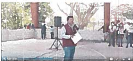
Minuto 6:01 a 8:00

Se observa al frente una persona de sexo masculino, cabello negro corto, viste un chaleco color rojo en el que se lee "morena", camisa gris de mangas largas y pantalón azul; sostiene en las manos un micrófono y hojas de papel. Se visualiza un grupo de personas de diferentes edades, sexos y vestimentas, unos sentados y otros parados.