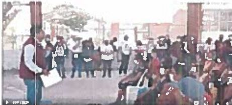
Minuto 2:01 a 4:00

Se observa al frente una persona de sexo masculino, cabello negro corto, viste un chaleco color rojo en el que se lee "morena", camisa gris de mangas largas y pantalón azul; sostiene en las manos un micrófono y hojas de papel. Se visualiza un grupo de personas de diferentes edades, sexos y vestimentas, unos sentados y otros parados.