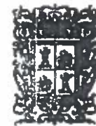
TRIBUNAL ELECTORAL DEL ESTADO DE CAMPECHE MAGISTRATURA 2 SAN FRANCISCO DE CAMPECHE, CAMP., MEX.