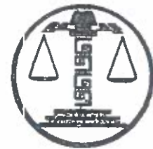
TRIBUNAL ELECTORAL DEL ESTADO DE CAMPECHE PRESIDENCIA