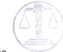
TRIBUNAL ELECTORAL DEL ESTADO DE CAMPECHE SECRETARIA GENERAL DE ACUERDOS

Con fecha (10 de octubre de 2024), se turnan los autos a la actuario para su debida notificación. Conste.