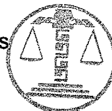
TRIBUNAL ELECTORAL DEL ESTADO DE CAMPECHE SECRETARÍA GENERAL DE ACUERDOS

Con esta misma fecha (16 de enero de 2025), hago entrega de los autos a la actuaría de este tribunal para su diligenciación. Conste.