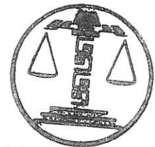
TRIBUNAL ELECTORAL DEL ESTADO DE CAMPECHE PRESIDENCIA