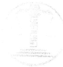
TRIBUNAL ELECTORAL DEL ESTADO DE CAMPECHE SECRETARIA GENERAL DE ACUERDOS

Con fecha (4 de febrero de 2025), turno los autos a la actúa para su debida notificación, Conste.