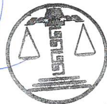
INGRID RENÉE PÉREZ CAMPOS MAGISTRADA

TRIBUNAL ELECTORAL DEL ESTADO DE CAMPECHE MAGISTRATURA 3