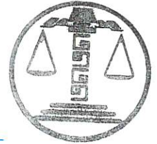
INGRID RENÉE PÉREZ CAMPOS MAGISTRADA

TRIBUNAL ELECTORAL DEL ESTADO DE CAMPECHE MAGISTRATURA 3